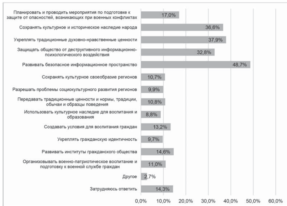
Рисунок 1. Что необходимо для обеспечения социокультурной безопасности / What is necessary to ensure sociocultural security