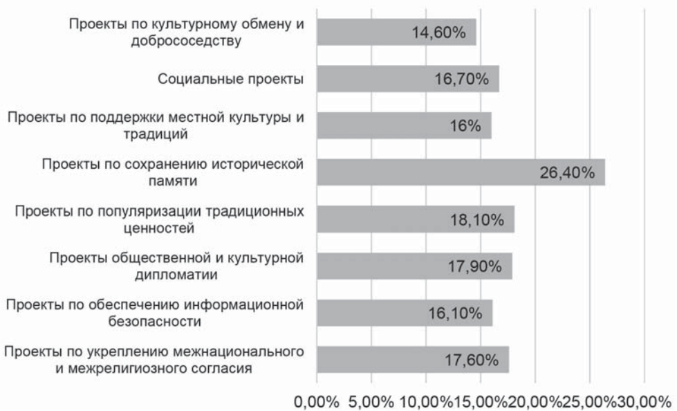
Рисунок 3. Что имеет наибольшее значение для развития социально-культурного пространства приграничных регионов / What is most important for the development of the socio-cultural space in the border regions

внутри многонационального приграничного сообщества. «Поддержка местной культуры» (38,8%) и «Широкая поддержка традиций...» (37,7%) также имеют высокий уровень у населения, что отражает запрос на укрепление локальной идентичности и культурного суверенитета.